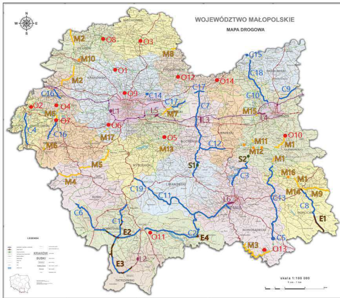
Rys. 2. Planowane inwestycje drogowe w Małopolsce do roku 2023