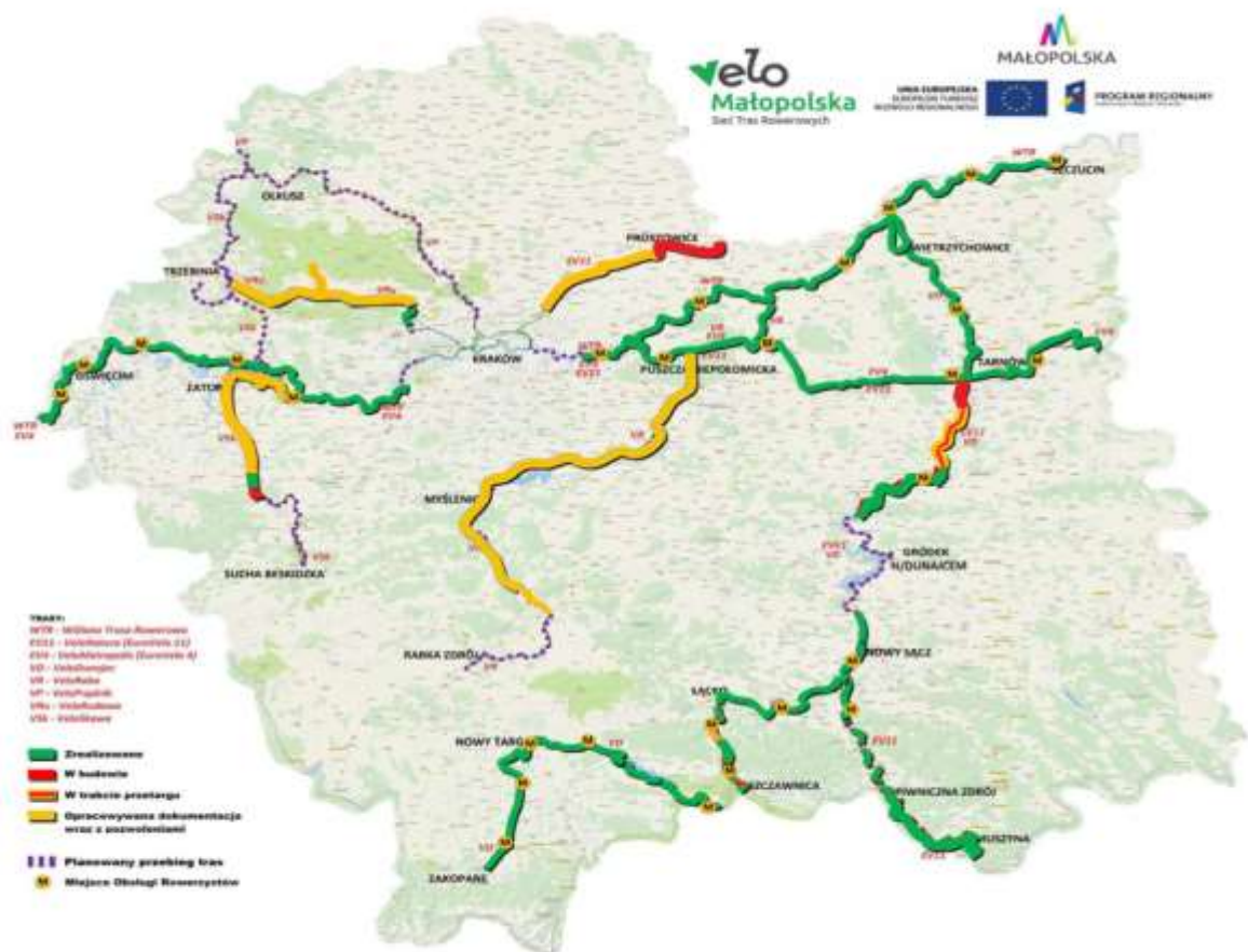
Rys 1. Przebieg planowanych do realizacji tras rowerowych w Małopolsce. Zaawansowanie Projektu VeloMałopolska, stan na dzień 20 marzec 2023 r.

W obszarze OCHRONA ŚRODOWISKA przewidziano do realizacji 10 projektów (5 infrastrukturalnych i 5 nieinfrastrukturalnych) na szacunkową kwotę 490 891 781 zł.